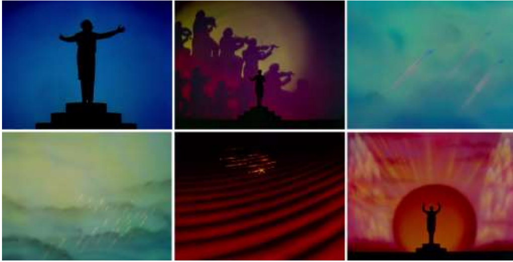
Görsel 1. Fantasia, Toccata and Fugue in D Minor , 1940, Animasyon

Fantasia'nın açılışında dikkat çeken bir başka nokta ise açılışın karanlık bir atmosfere sahip olmasıdır. Bu durum, içinde bulunulan dönemin koşullarına bağlanabilir. Film, 2. Dünya Savaşı'nda Hollywood animasyonunun propaganda dönemi eşiğinde ortaya çıkmıştır. Filmde savaş propagandası konusunda doğrudan bir gönderme olmasa da Mik (2021)'in belirttiği gibi açılış ürkütücü ve ani renk değişimleriyle elbette dönemin zahmetli gerilimiyle ilişkilendirilebilir.