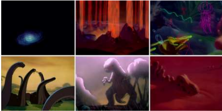
Görsel 4. Fantasia, Rite of Spring , 1940, Animasyon

Yeryüzündeki yaşamın evrimsel aşamalarını sunarak evrim teorisini öğreten Disney, seyircisini aynı zamanda Darwin'in doğal seçilimi konusunda da eğitmiştir. Filmde Stegosaurus gibi otobur bir türle T-Rex gibi etobur bir tür arasındaki av-avcı ilişkisine tanık olunuyor. Etobur türün hayatta kalabilmesi için avlanması, otobur türün ise kaçması gerekmektedir. Burada Darwin'in başarılı ve en uygun olanın hayatta kalması teorisi anlatılır. Ancak bir süre sonra ne yazık ki iki türün de yeryüzünden silindiği görülmektedir. Disney burada seyircisine bir ders daha vermektedir: sekansın üzücü bir şekilde sonlandırılması aslında gelecekte işleri daha farklı yapmamız açısından bir teşvik görevi de görmektedir (Brode, 2004: 120).