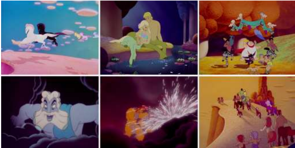
Görsel 5. Fantasia, Pastoral Symphony , 1940, Animasyon

Son sahnede şenliği aniden başlayan şiddetli bir fırtına sonlandırmaktadır. Zeus koyu bulutlar arasından çıkmakta ve Vulcan'ın dövmüş olduğu yıldırımları Bacchus'a kasten ve hiddetli bir şekilde yöneltmektedir. Burada Zeus, o dönemde ABD'yi bekleyen gerçek savaşı hatta Fantasia'nın her bölümünde izlerine rastlanabilen savaşı temsil etmektedir (Mik, 2021: 591).