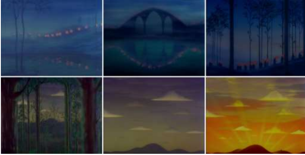
Grsel 8. Fantasia, Ave Maria , 1940, Animasyon

Blmde hareket epey kısıtlı ve grntler olduka minimaldir. Hareket yalnızca elinde bir ışık kaynağını taşıyan rahiplerin geişinde ve kamera geişlerinde grlmektedir. Rahiplerin getiđi sahnede, ellerindeki ışığın suya yansımalarının ustaca tasvir edildiđi bunun grntye inandırıcılık kazandırdığı grlmektedir. Rahiplerin zerinden getikleri kprnn  gotik kemerle desteklenmesi kprye gl bir ayinsel rezonans kazandırmaktadır (Benzon, 2011: 79). Kamera geişinde grlen nl arkalı ağalarda ise etkileyici bir derinlik etkisi gzlemlenmektedir. Belirli blgelere uygulanan flu alanlar bu derinliđi daha da pekiştirmektedir. Walt Disney, elbette animasyonda derinlik izlenimini geliştirmeye alışan ilk animatr deđildi; ancak derinliđi iyi şekilde kullanan ve animasyon filmlerinde bunu en st dzeye ıkaran ilk kişiydi (Lenburg, 2011: 66).