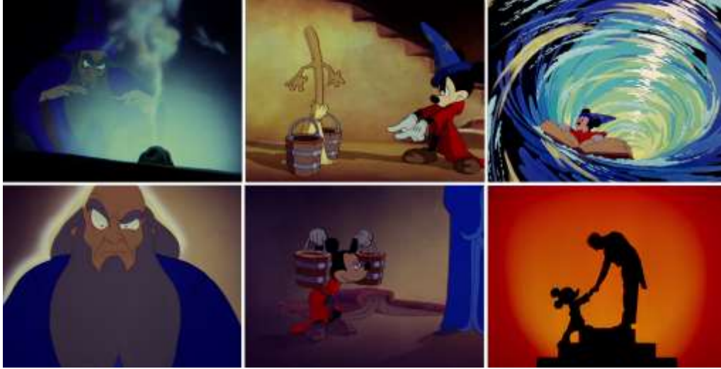
Grsel 3. Fantasia, The Sorcerer's Apprentice , 1940, Animasyon