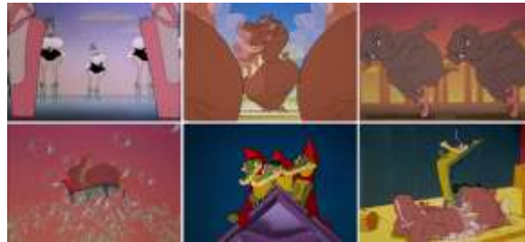
Grsel 6. Fantasia, Dance of the Hours , 1940, Animasyon